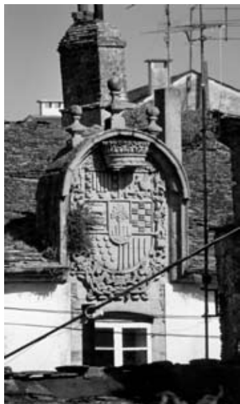
El pazo de Sangro, luce en su fachada el mejor blasón de todos cuantos hay en la ciudad

Beltran, D. Domingo , herrero, de treinta y seis años, casado, vivía con su esposa y tres hijos menores de edad.