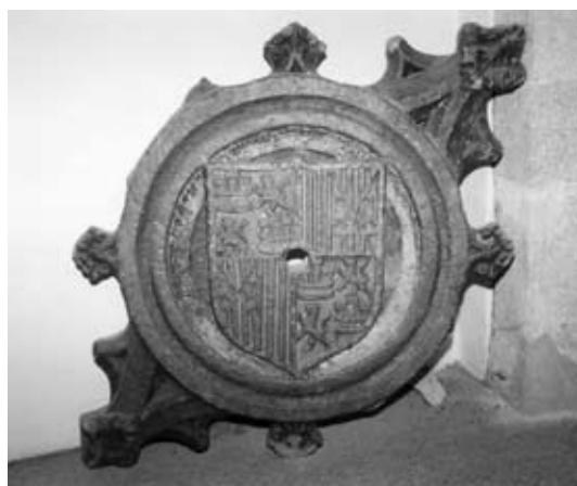
< Museo Diocesano, escudo real que corresponde al reinado los Reyes Católicos y que posiblemente formara parte de la clave del crucero de la capilla de los reyes en la catedral lucense