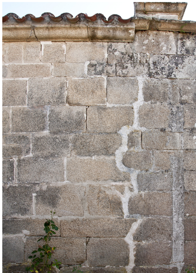
Detalle de la fábrica del edificio, en hiladas de granito