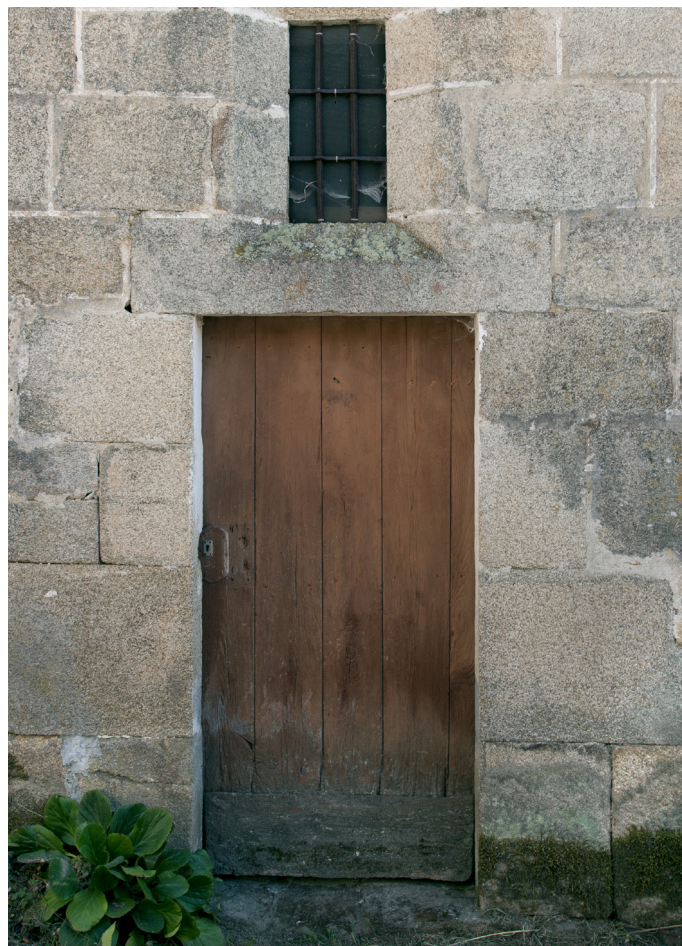
Puerta lateral de acceso