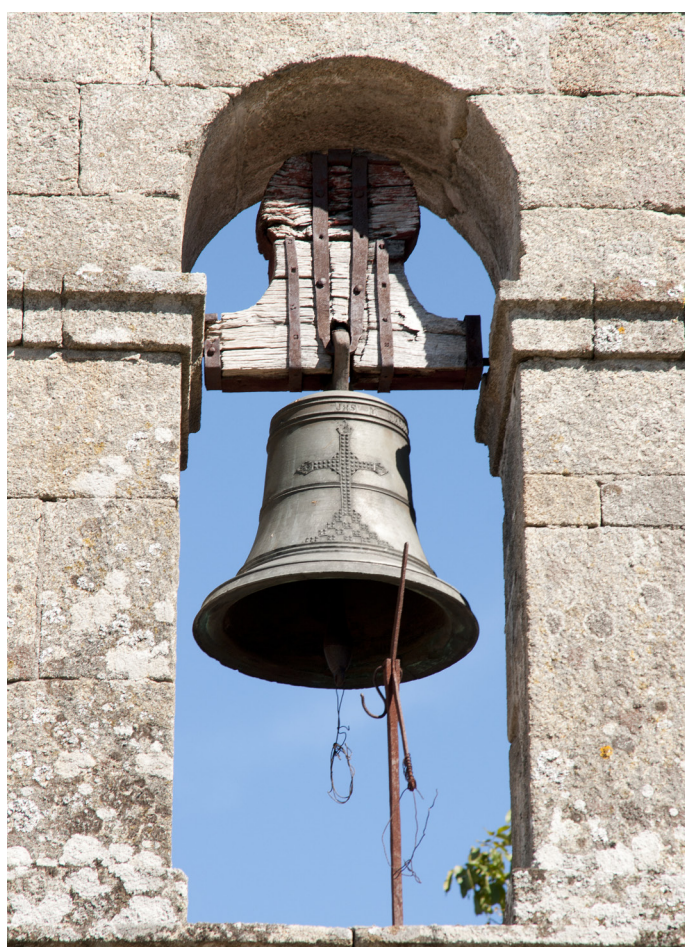
Campana grande realizada en 1918 por el taller de Gregorio Blanco Ysla, de Monforte