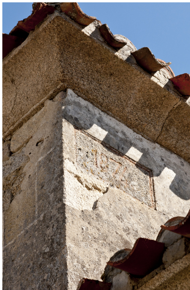
Fecha en que la iglesia fue reformada: 1876