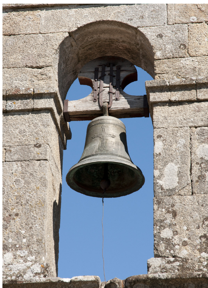
Campana pequeña, del taller de Gregorio Blanco de Monforte, fundida en 1944