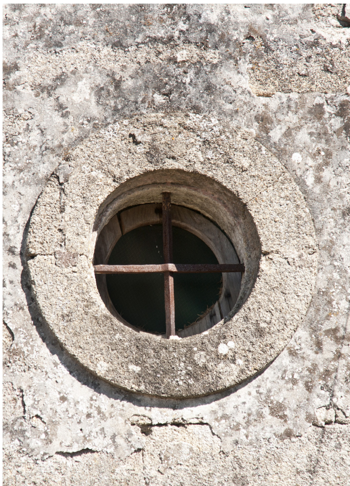
Vidriera sobre la puerta principal